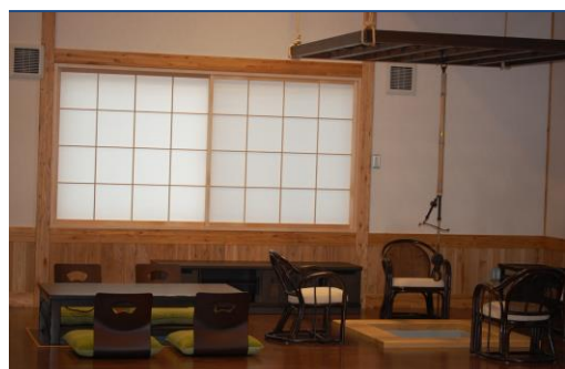
囲炉裏のある風景